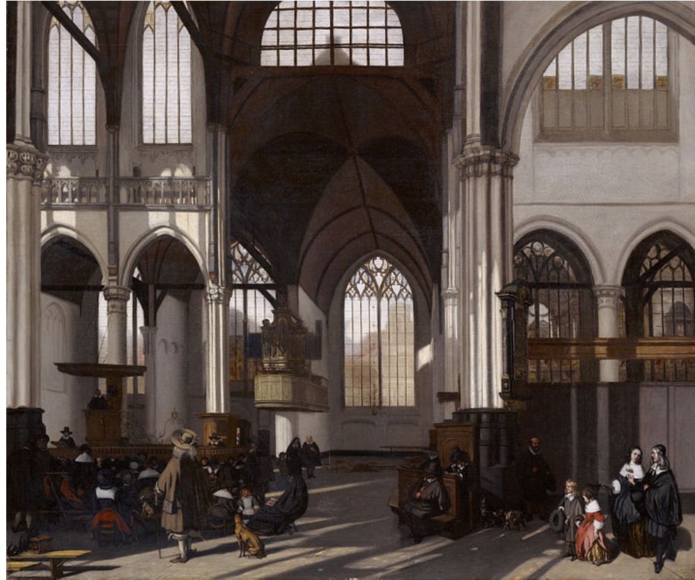
Interieur van de Oude Kerk (1661), Emanuel de Witte